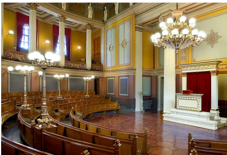
Gamle Festsal, UiO.

Ellers kan vi melde at FAANs årsmøte ble avholdt digitalt 14. juni, og nye og gamle styremedlemmer presenteres helt sist i nyhetsbrevet.